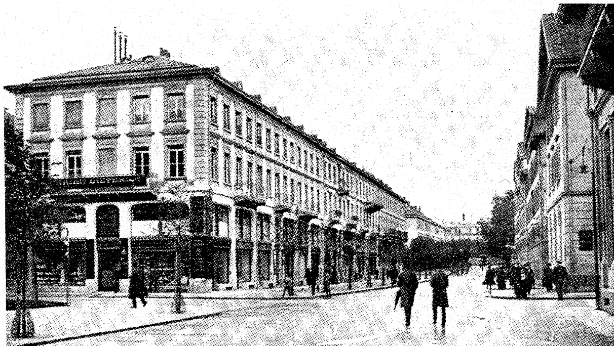
Poststrasse, Schützengasse bis Waisenhausstrasse; Nordseite vor 1914